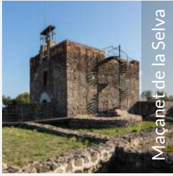
Maçanet de la Selva