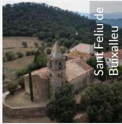
Sant Feliu de Buixalleu