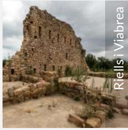
Riells i Viabrea