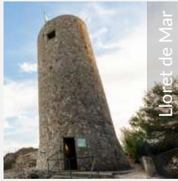
Lloret de Mar