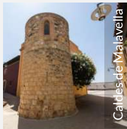
Caldes de Malavella